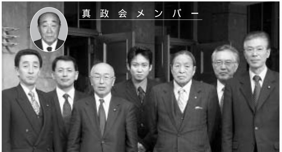
真 政 会 メ ン バ ー